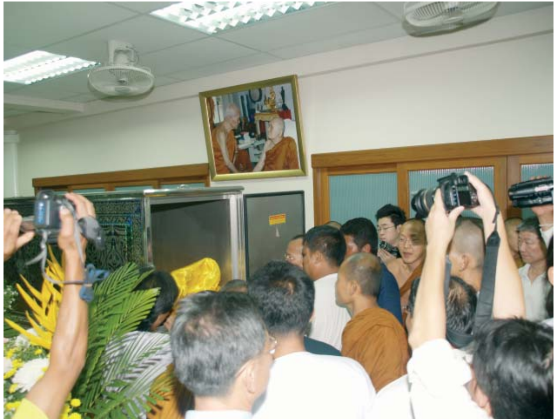
พิธีบรรจุศพเข้าสู่โลงเย็น วันที่ ๑๙ มิถุนายน ๒๕๕๐