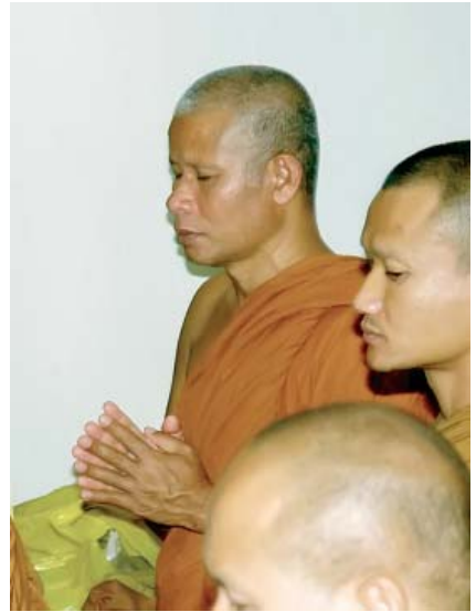
ภาพล่าสุดของพระอาจารย์ชิต อีกมุมหนึ่ง

ในท้ายสุดท่านยังย้ำในเรื่องของการปฏิบัติให้ระลึกถึงพุทธโธอยู่ทุกเมื่อ