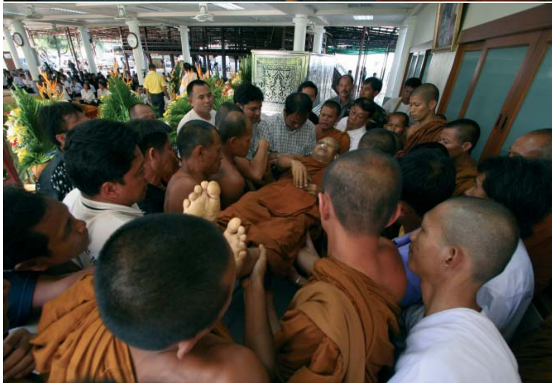
เคลื่อนย้ายศพเข้าสู่สวนแสงธรรม