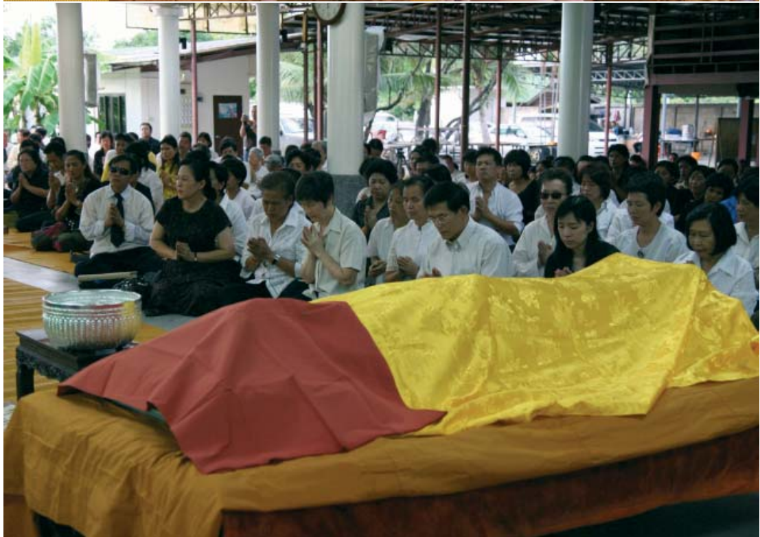
คณะสงฆ์และญาติโยม ร่วมไว้อาลัยศพท่านพระอาจารย์ชิต