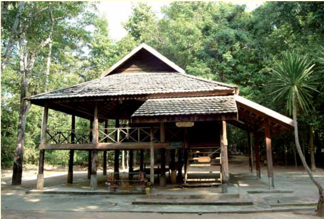
กุฏิหลวงปู่มั่น ภูริทัตโต บ้านหนองผือ

ประมาณเพิ่มขึ้นอีก จึงได้เดินทางเข้าไปกราบเท้าพระอาจารย์สาร และขอเรียนให้ท่านช่วยเล่าเรื่องของท่านอาจารย์พรหมสมัยยังเป็นฆราวาสแสวงหาความสุข และออกบวชจนรู้แจ้งชัดพันทุกข์ เพื่อเป็นคติตัวอย่างในทางพันทุกข์บ้าง