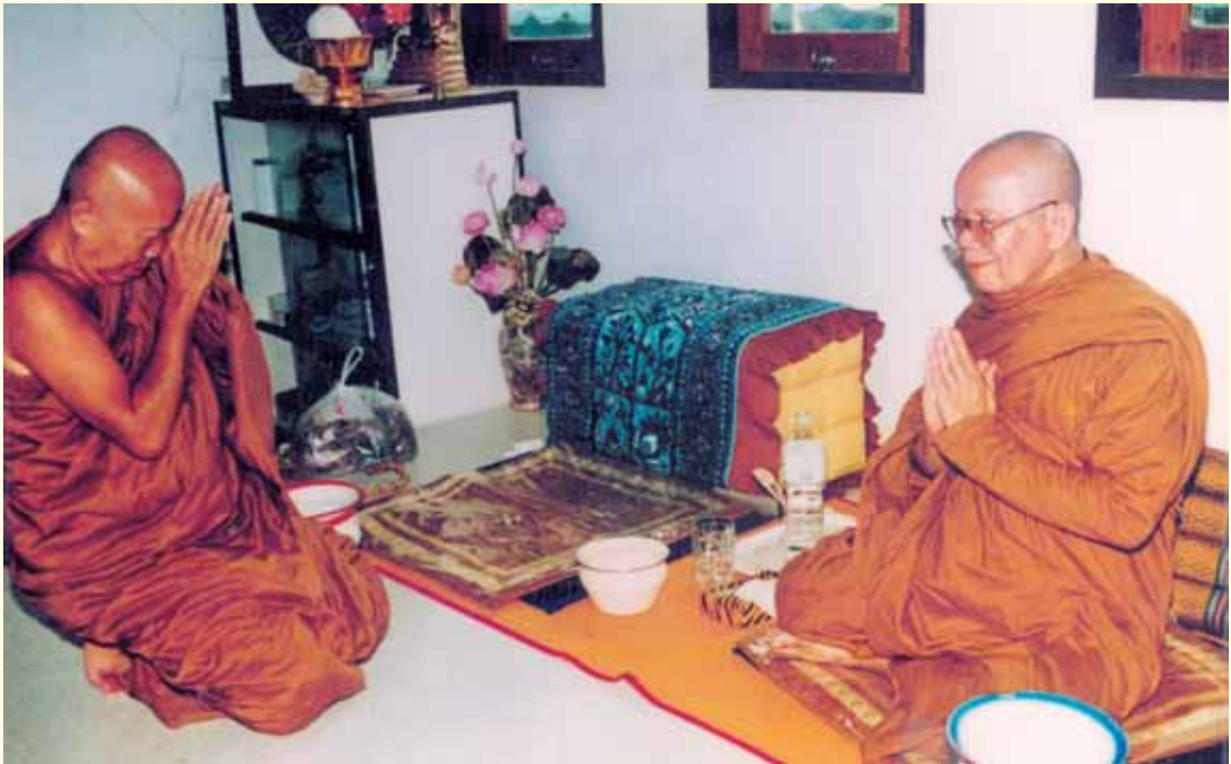
หลวงปู่อ่อนศรี จานวโร กราบหลวงปู่ฝั้น จิตฺตมฺโฆ

เมื่อถึงฤดูผลไม้ทางภาคตะวันออก ก็จะฝากขึ้นไปถวายตามวัดต่าง ๆ รวมถึงข้าวของเครื่องใช้ต่าง ๆ ท่านปรารภเสมอว่า วัดทางอีสานที่ขาดแคลนยังมีอีกมาก ทางเรามีเหลือใช้ก็ควรสงเคราะห์ผู้อื่นบ้าง