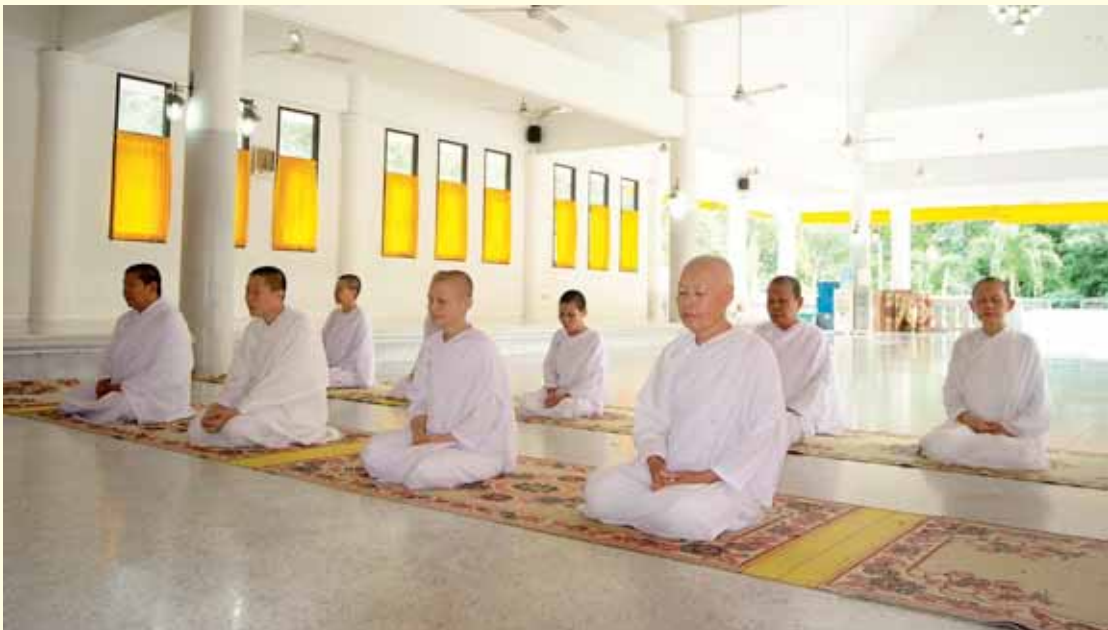
การนั่งทำสมาธิภาวนาที่วัดถ้ำประทุน

วันไหนถ้าทำถึงแล้ว เป็นแล้ว มันง่าย คือเพียงแต่ไปบิณฑบาต เวลาเย็นคอย จิตมันจะสงบแพลงไป แต่เวลาจะเข้าถึงคราวแรกยากมาก