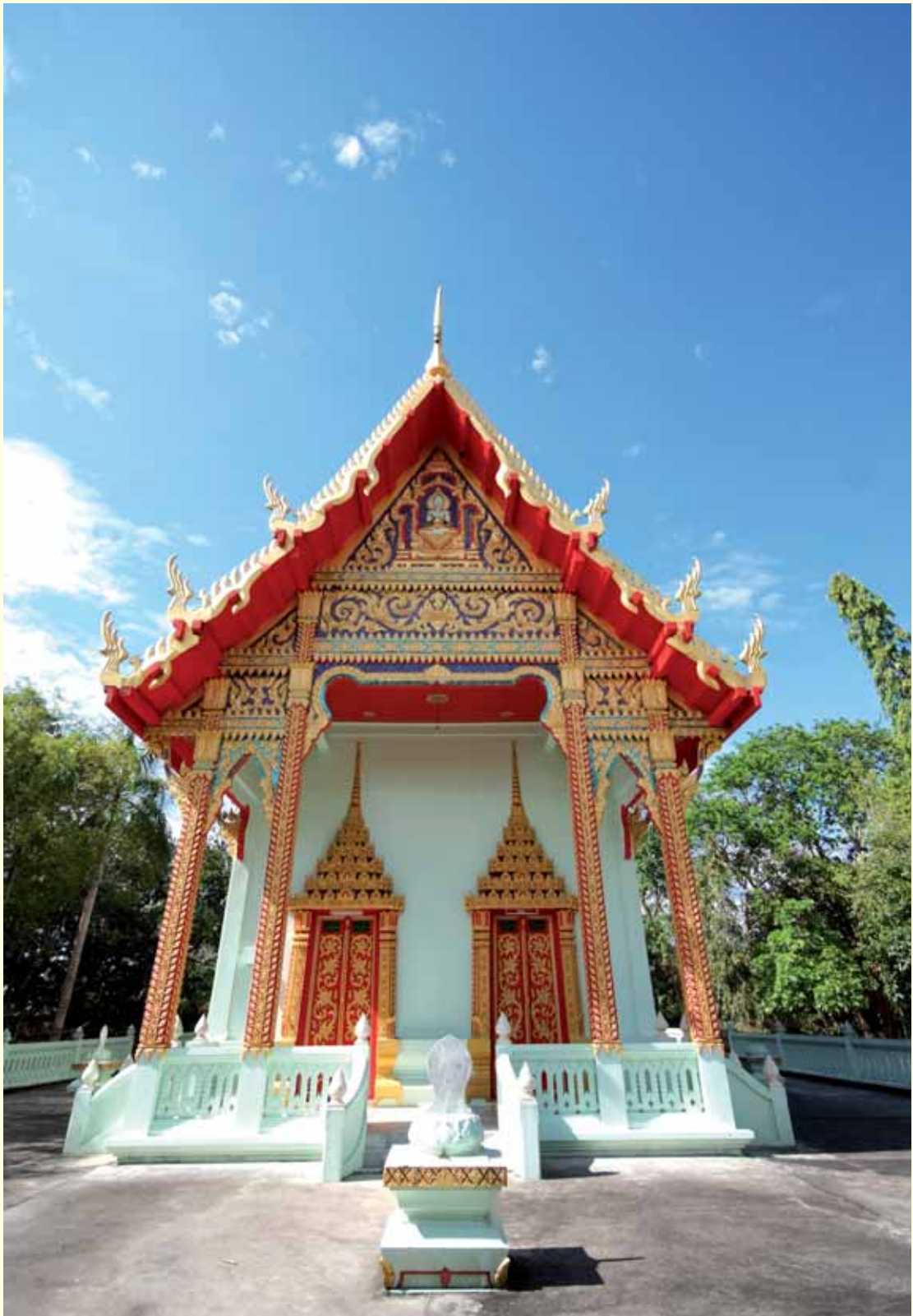
พระอุโบสถวัดต่างธรรมาราม