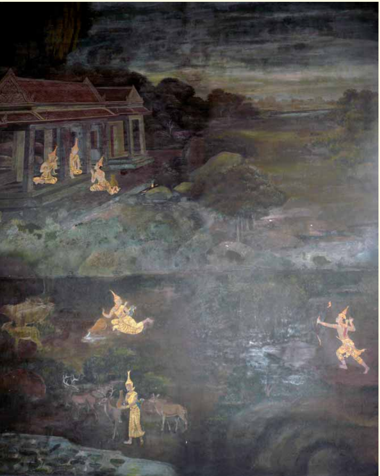
ภาพจิตรกรรมฝาผนังเรื่องสุวรรณสาม บนผนังอุโบสถวัดระฆังโฆสิตาราม กรุงเทพมหานคร