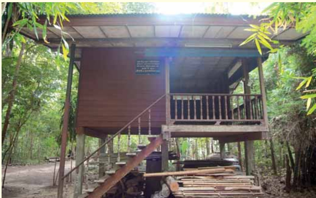
กุฏิวัดธรรมิการาม