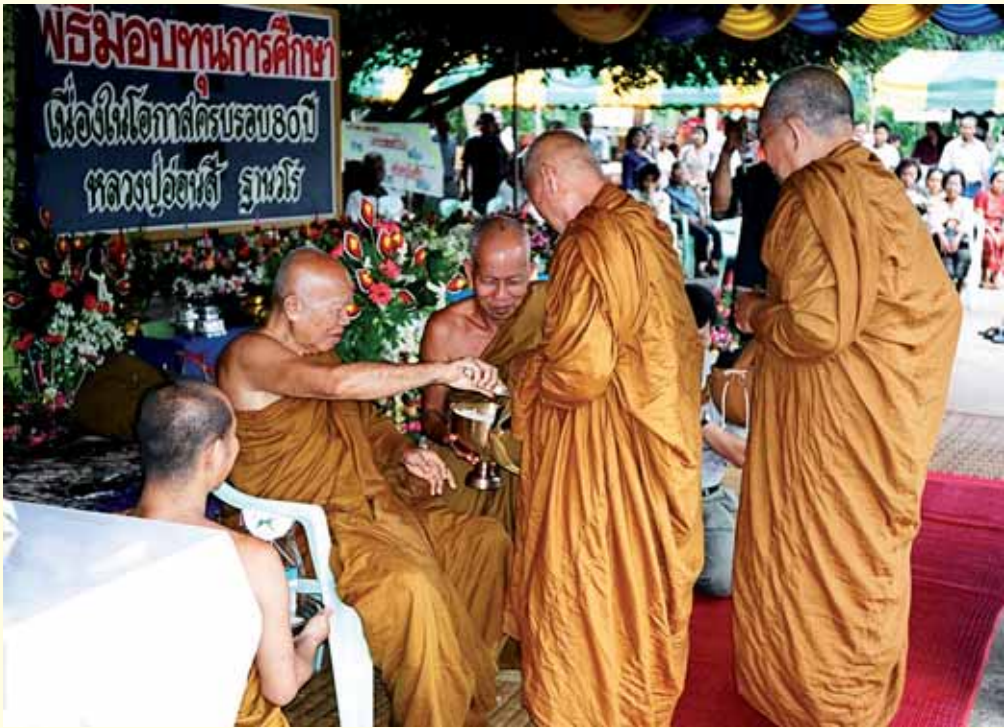
หลวงปู่อ่อนศรี จานวโร กำลังใส่บาตรพระสงฆ์