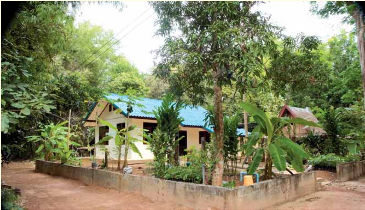
กุฏิวัดธรรมิการาม

แต่ถ้าคนเชื่อ ก็คอยทำบุญแต่พระรูปนั้น ส่วนพระองค์อื่น ๆ ก็เป็น อยู่ลำบาก