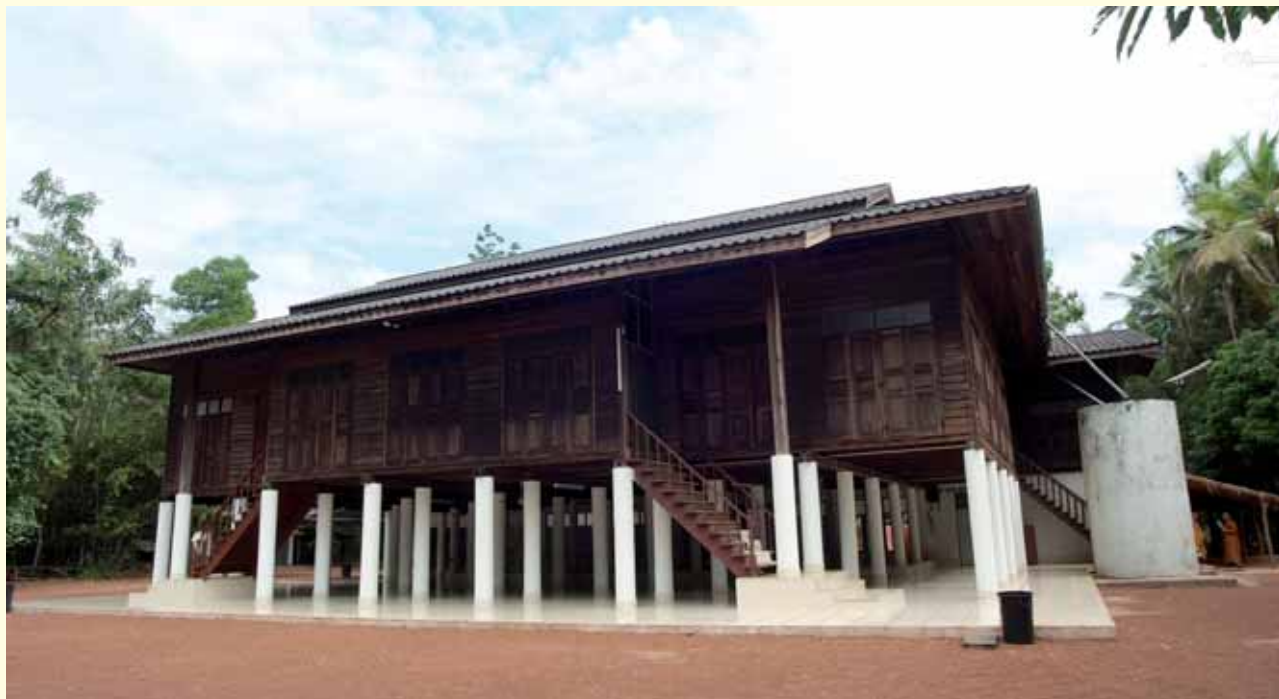
ศาลาวัตรธรรมิการาม ที่หลวงปู่อ่อนศรี จานวโร เป็นผู้สร้าง เป็นงานฝีมือของท่านทั้งหลัง

ศาลาวัตรธรรมิการาม กว่าจะเป็นศาลาที่เห็นมีโซ่ของง่ายเพราะสมัยนั้น เครื่องไม้เครื่องมือหายาก ต้องใช้แรงคนเกือบทั้งสิ้น บางอย่างต้องอาศัย เกวียนไปขนลากมาจากที่ไกล ๆ และงานนั้นก็ดูเหมือนเป็นงานแรกของท่าน ที่ท่านต้องใช้กำลังความคิดมาก แก้ปัญหาต่าง ๆ ที่เกิดขึ้น ทำไปคิดไปก็ว่าได้ ท่านพูดให้ฟังเสมอว่าถ้ามีโอกาสให้ไปดูนะ ไม่เหมือนที่อื่น เสาแต่ละต้นก็ใช้ กบมือใส่เอาทั้งนั้น สิ่งก่อสร้างที่องค์กรท่านเพียรทำแต่ละแห่ง จะเน้นความ มั่นคงแข็งแรงเป็นพิเศษ