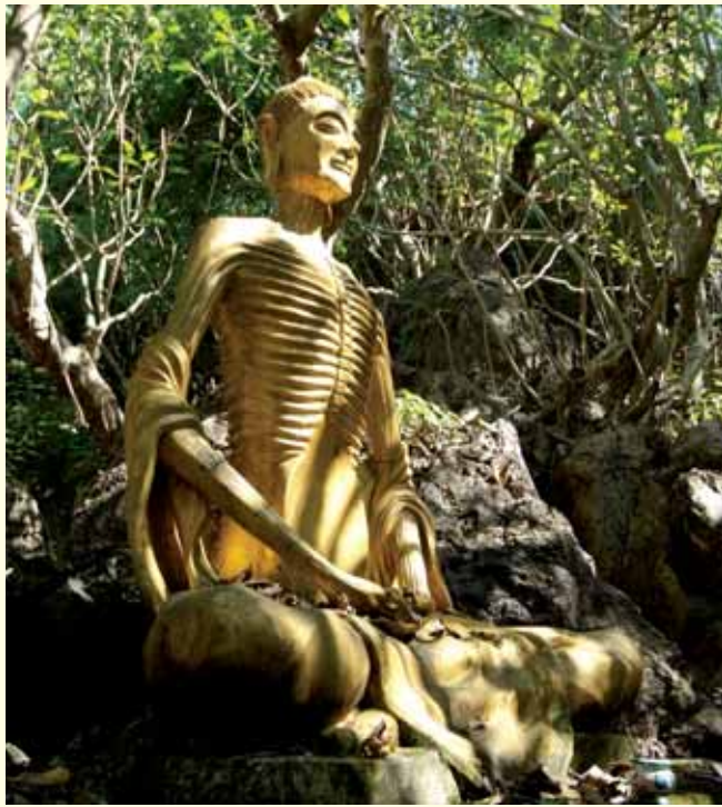
รูปปั้นพระพุทธเจ้า ทรงบำเพ็ญทุกรกิริยา

ความชุ่มเย็น ชีวิตของราชกุมารจึงอยู่ได้ ธาตุไฟให้ความอบอุ่น ธาตุลมให้ พั่ววีซึ่งทำให้ราชกุมารมีชีวิตเป็นอยู่ได้” ดังนี้ ให้โยมพรหมพิจารณาดูให้ดี