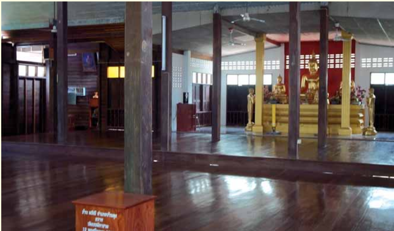
พระประธานภายในศาลา วัดธรรมิการาม ที่หลวงปู่อ่อนศรี จานวโร เป็นผู้สร้าง