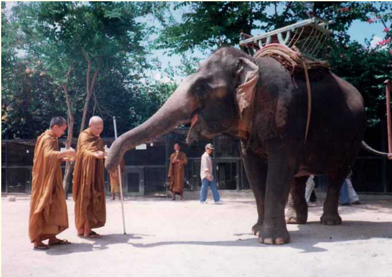
หลวงปู่กำลังให้อาหารช้าง

เจ้าของช้าง เขาได้ยินเช่นนั้น เขาก็ดำคนที่พูดเช่นนั้น เขาไม่ให้พูดอย่างนั้น ถ้าพูดอย่างนั้นทำให้ช้างเขาเสียกำลังใจ