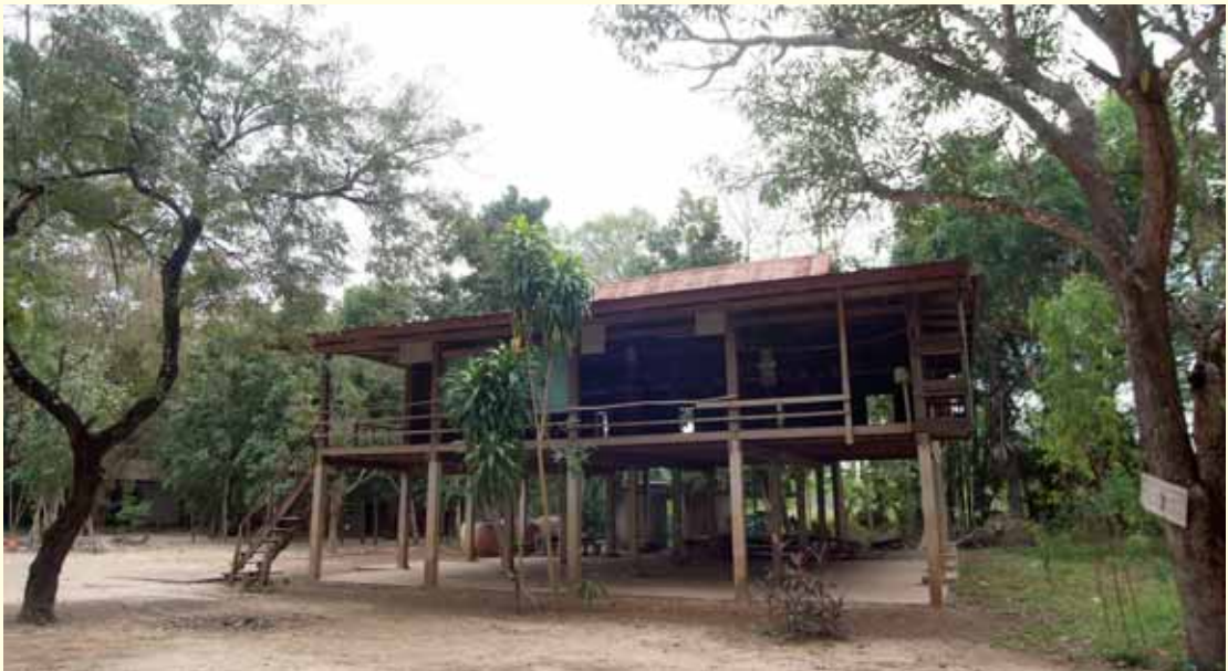
ศาลาเก่า วัดตาลนิมิตร สมัยหลวงปู่พรหม มาจำพรรษา

หลวงปู่พรหม เดิมมีภรรยาชื่อ กองแพง บวชเป็นแม่ชีก่อนหลวงปู่พรหมบวช ๑ ปี บวชได้ ๖๐ กว่าพรรษา แล้วก็ตายหลังหลวงปู่พรหม บวชอยู่กับหลวงปู่สาร วัดป่าบ้านโคกดอน