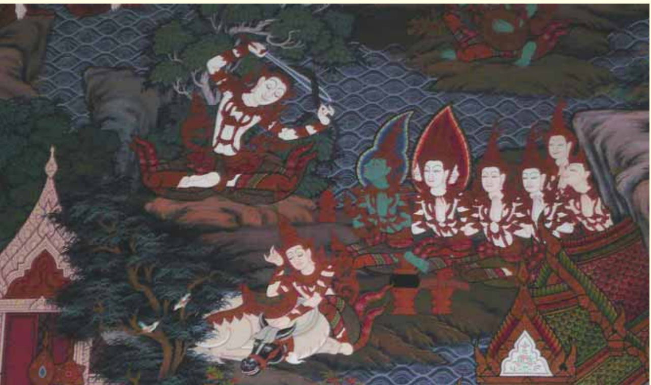
ภาพพุทธประวัติ ตอนทรงตัดพระโมฬีแล้วอธิษฐานเพศเป็นบรรพชิต จิตรกรรมฝาผนังในอุโบสถวัดหัวลำโพง กรุงเทพมหานคร

ชีวิตทุกชีวิตไม่พ้นไปจากความชรา พยาธิ มรณะได้ พระองค์เห็นว่า เป็นเพลิงอันใหญ่หลวงเผามนุษย์และสัตว์ให้พินาศฉิบหายอยู่ไม่หยุดหย่อน นับว่าเป็นมหันตทุกข์มหันตภัยอันใหญ่หลวงในโลกนี้