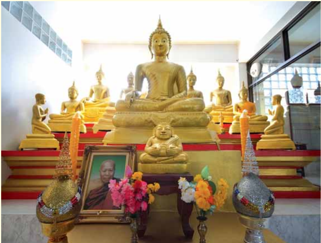
พระประธานที่วัดดำรงธรรมาราม มีรูปหลวงปู่อ่อนศรีตั้งเป็นที่สักการะ

ท่านย่าในเรื่องนี้ว่า “เมื่อละกิเลสได้ตามส่วน บรรลุอุริยมรรค อริยผล ตามลำดับ สามารถเห็นเทวดาได้” (วันที่ ๑๑ พฤษภาคม ๒๕๕๐)