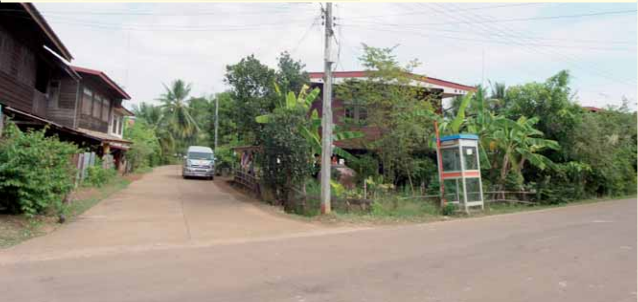
ถนนทางไปวัดที่หลวงปู่พัฒนา