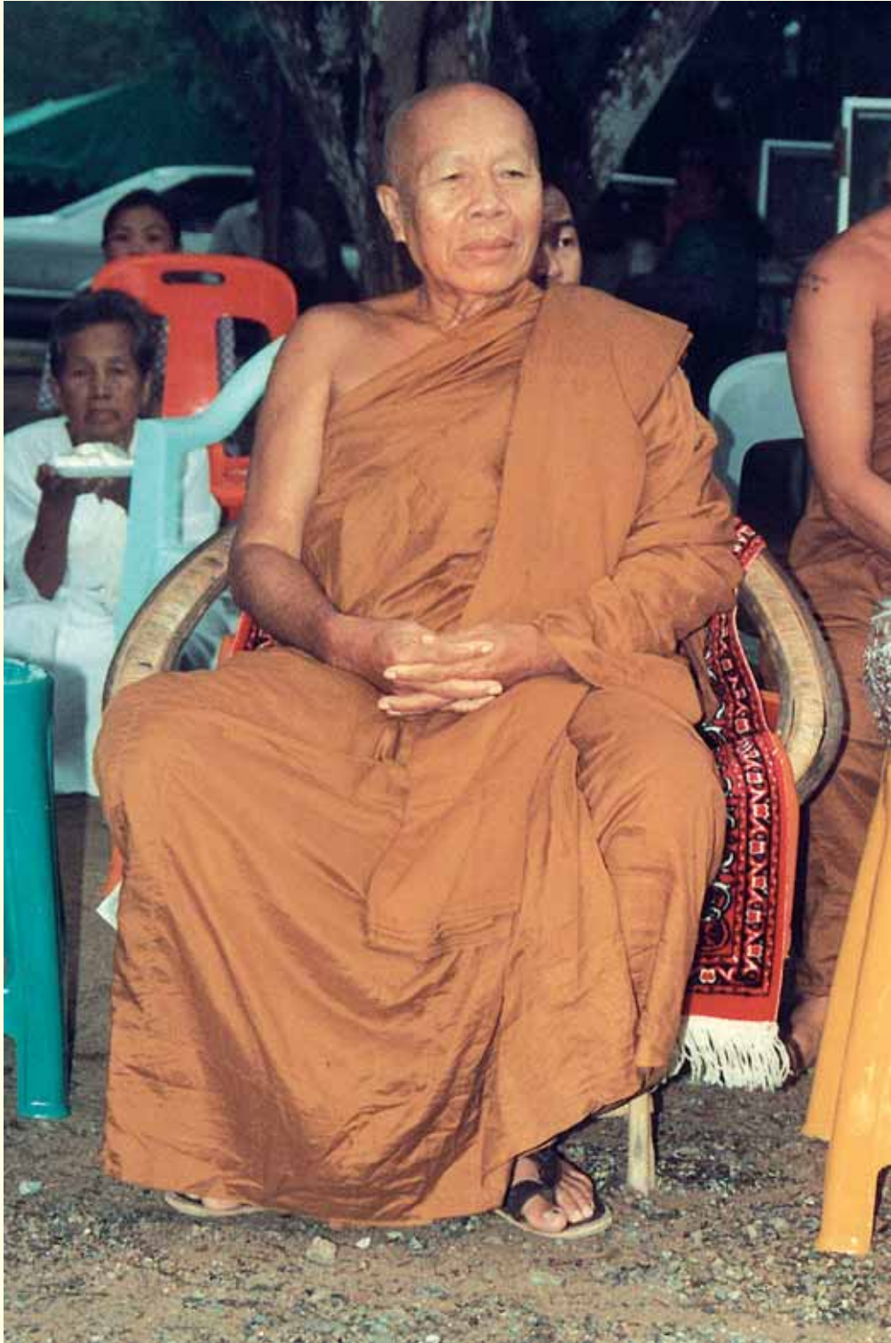
หลวงปู่จันทน์ ญาณโร