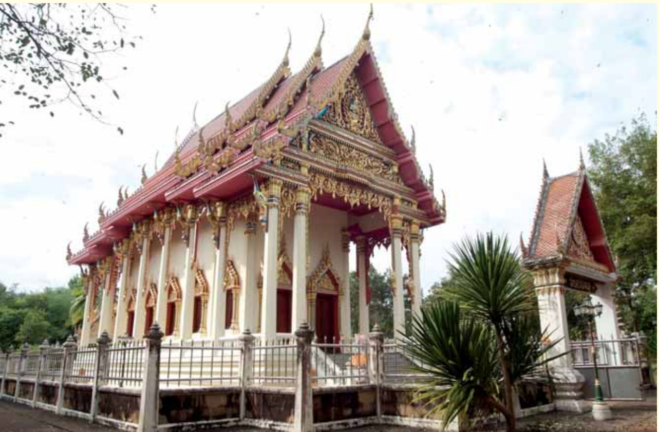
โบสถ์วัดสีชมพู

สิ่งที่น่าภูมิใจต่อมาเห็นจะเป็น “โบสถ์วัดสีชมพู” เป็นโบสถ์หลังที่สองที่ท่านได้สร้างในชีวิตของท่าน สมัยนั้นยังไม่มีกลุ่มศรัทธามากนัก การหาปัจจัยต้องค่อยเป็นค่อยไป สมัยนั้นเงิน ๑๒ ล้านบาทก็หาได้ไม่ถ่ย่ายนัก ต้องทอดกฐินกันหลายปี ผ้าป่าหลายต่อหลายครั้งทีเดียว แต่ก็ต้องถือเป็นจุดเริ่มต้นแห่งการเปิดโอกาสให้คนทางแถบชลบุรีและกรุงเทพฯ เข้าไปรู้จักบ้านเกิดเมืองนอนท่าน และนำความเจริญอีกมากมายตามเข้าไปในเวลาต่อมา มีกฐินจากทางชลบุรีไปทอดทุกปีในวัดแถบนั้น หลวงปู่ท่านไม่เคยลืมบ้านเกิด แต่ละปีคิดอยู่เสมอว่าจะเอาอะไรไปช่วยบ้าง โรงเรียนที่ท่านเคยอาศัยเรียน ท่านก็กลับไปส่งเคราะห์อยู่เสมอ ทั้งสร้างอาคารเรียน จัดหาอุปกรณ์การเรียนการสอน แห้งค้ำน้ำ เอาข้าวของไปแจกเด็กนักเรียนยากจน ให้ทุนการศึกษา ฯลฯ นอกจากนี้ ก็ช่วยตั้งคนในหมู่บ้านมาทำงาน ก่อสร้างประจำที่วัดถ้าประทุนบ้าง ในช่วงที่ว่างจากการทำนา เพื่อให้เขามีรายได้ มีความเป็นอยู่ที่ดีขึ้น