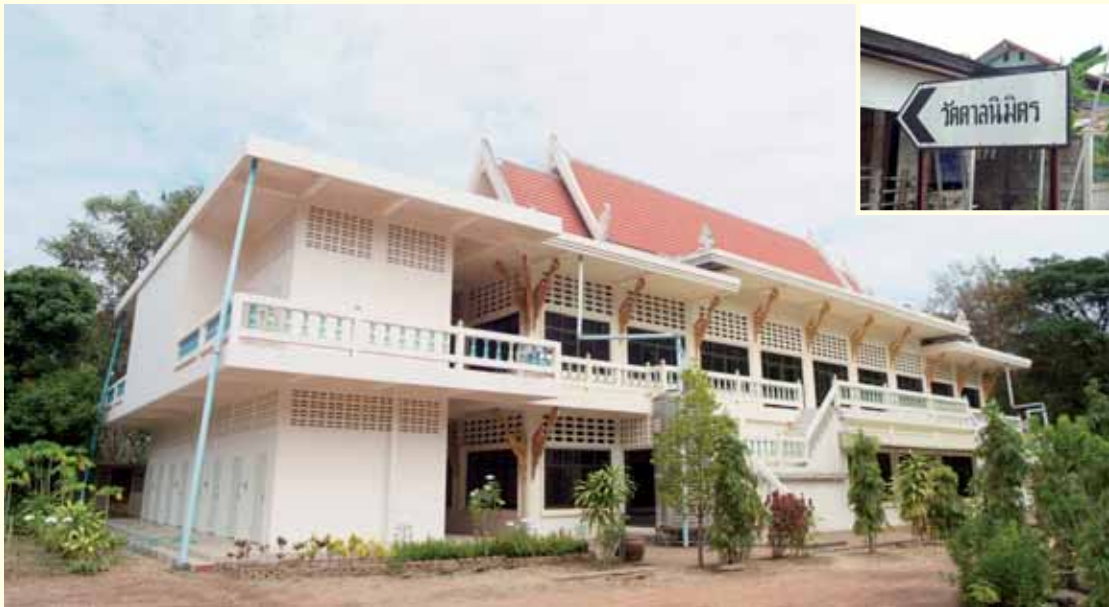
ศาลาใหม่ วัดตาลนิมิตร

ไกลถึงสังคมชุมชนน้อยใหญ่ให้มีแต่ความเจริญสุขสถาพร ยิ่งได้สร้างประโยชน์ให้แก่สังคมพลเมืองด้วยแล้วย่อมนำความเจริญรุ่งเรืองให้แก่ประเทศชาติบ้านเมืองต่างมีความสุขทุกเรือนชาน เพราะมนุษย์มีสติปัญญามีธรรมะประจำจิตใจด้วยกัน ก็มนุษย์นี้แหละกระทำขึ้นให้เกิดประโยชน์ทั้งสิ้น