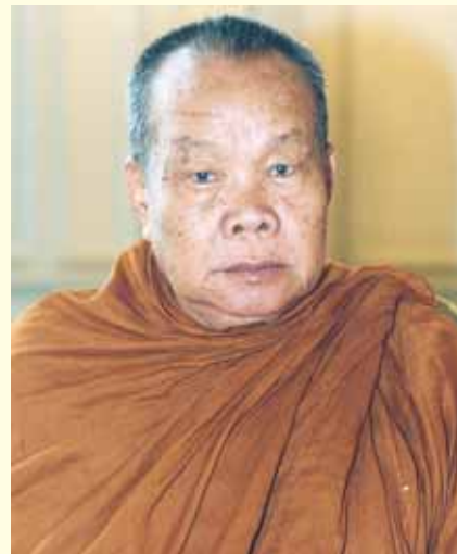
● หลวงปู่ลี กุศลธโร ●