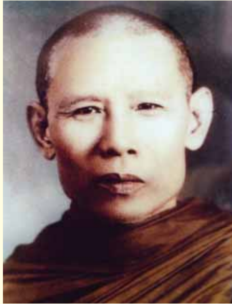
• ท่านพ่อลี ธมฺมชโร •