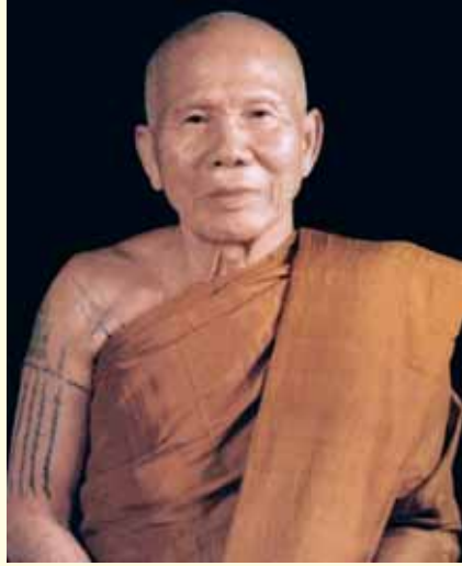
● หลวงปู่หล้า เขมปัตโต ●