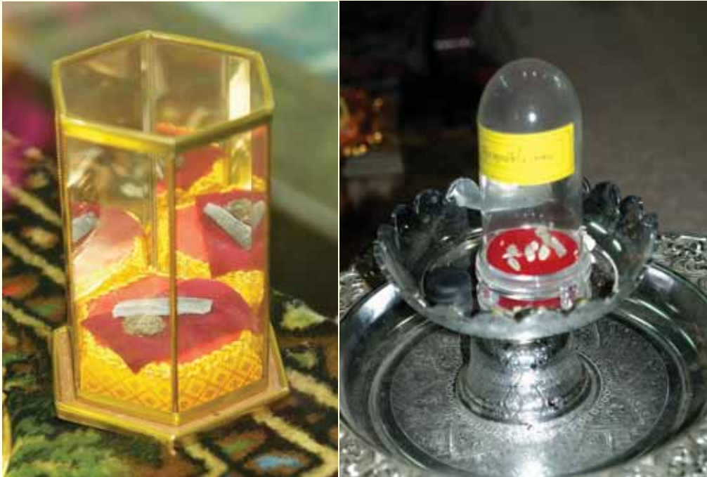
● อัฐิคุณยายกั้ง เทพิน ที่วัดบ้านหนองผือ ●