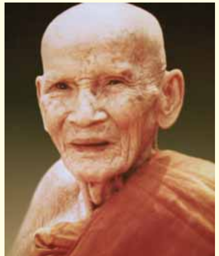
● หลวงปู่คำตัน จิตธมฺโม ●

● พระกรรมฐานยุคหัวยทราย ที่เคยอยู่กับหลวงตา ●