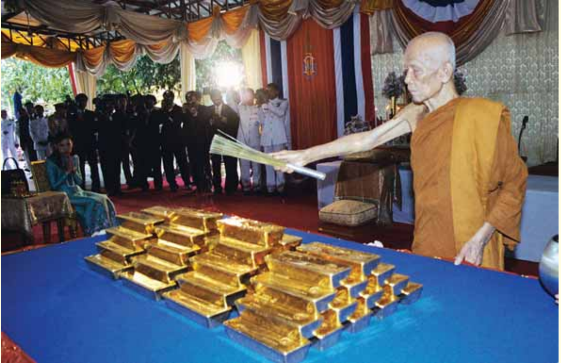
● หลวงตาประพรมน้ำมนต์บนทองคำที่มอบเข้าสู่คลังหลวง ●

มาบัดนี้มีใช้เรื่องบังเอิญ แต่เป็นเรื่องจริงที่น่าจะเป็นเครื่องส่องแสงให้เห็นถึงการที่ท่านจะได้มาช่วยยกชาติบ้านเมืองให้พ้นจากหล่มลึก คือกิเลสตัณหา ความทะยานอยากและความจน เป็นนิमितกระตุ่นเตือนถึงความเป็นผู้นำพาพี่น้องชาวไทยทั้งหลายชนทองคำเข้าสู่พระคลังหลวง ยกพระพุทธเจ้าเป็นใหญ่ โสจรสรวงคุณงามความดีเข้าสู่จิตใจประชาราษฎร์ สอนเขาให้ละทางแห่งความเลื่อม เพียรพยายาม เพิ่มพูนแนวทางแห่งความเจริญ สร้างผืนแผ่นดินให้เป็นแผ่นดินธรรมแผ่นดินทอง