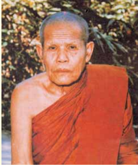
● หลวงปู่มหาบุญมี สิริธโร เป็นพระเถระที่เคยอยู่ร่วมกับหลวงตาที่ห้วยทราย ●

ข้อปฏิบัติที่ท่านถือเคร่งในยุคนั้นคือ ปฏิบัติอย่างหยาบ ๆ ห้ามนอนก่อน ๔ ทุ่ม ถ้าใครนอนก่อน ๔ ทุ่ม ต้องตื่นขึ้นมาทำความเพียรก่อนตี ๔ ถ้าผิดจากนี้ ได้ตักเตือนถึงสามครั้ง ถ้าทำไม่ได้ท่านจะไล่หนีจากวัดทันที