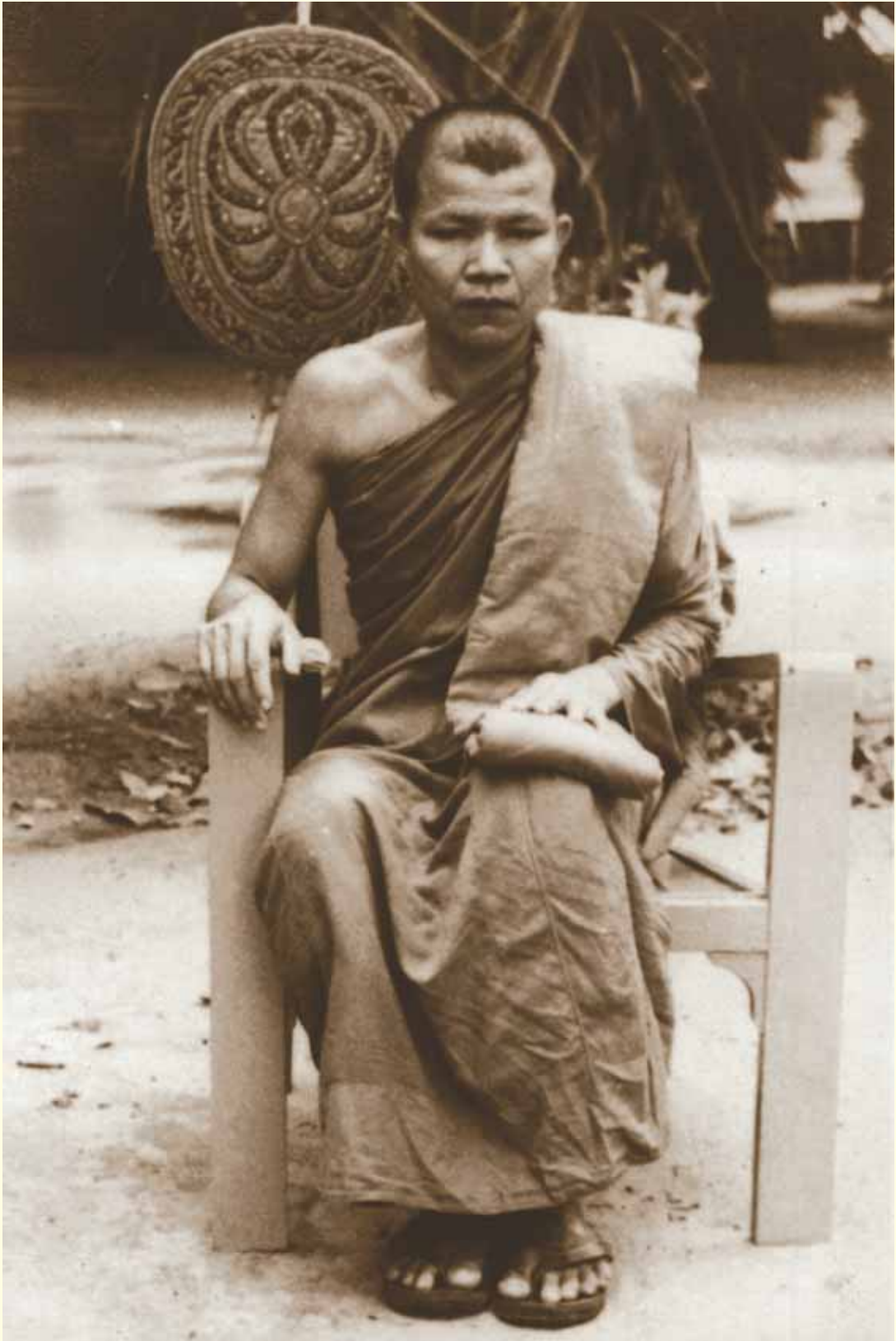
● ภาพถ่ายหลวงตาที่วัดป่าสุทธาวาส หลังจากบรรลุนิกรรมได้เพียง ๑ วัน (๑๖ พฤษภาคม พ.ศ. ๒๔๙๓) ●