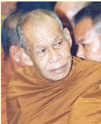
● หลวงปู่เพียร วิริโย ●