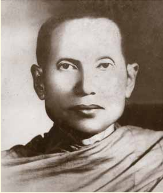
● พระอาจารย์มหาทองสุก สัจจิตโต ●