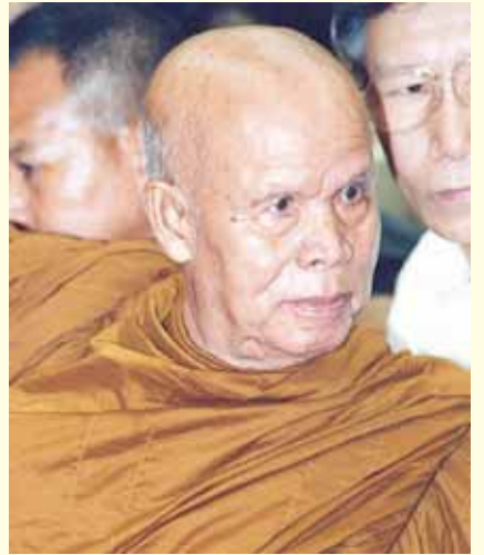
● หลวงปู่บุญมี ปริบุญโญ ●